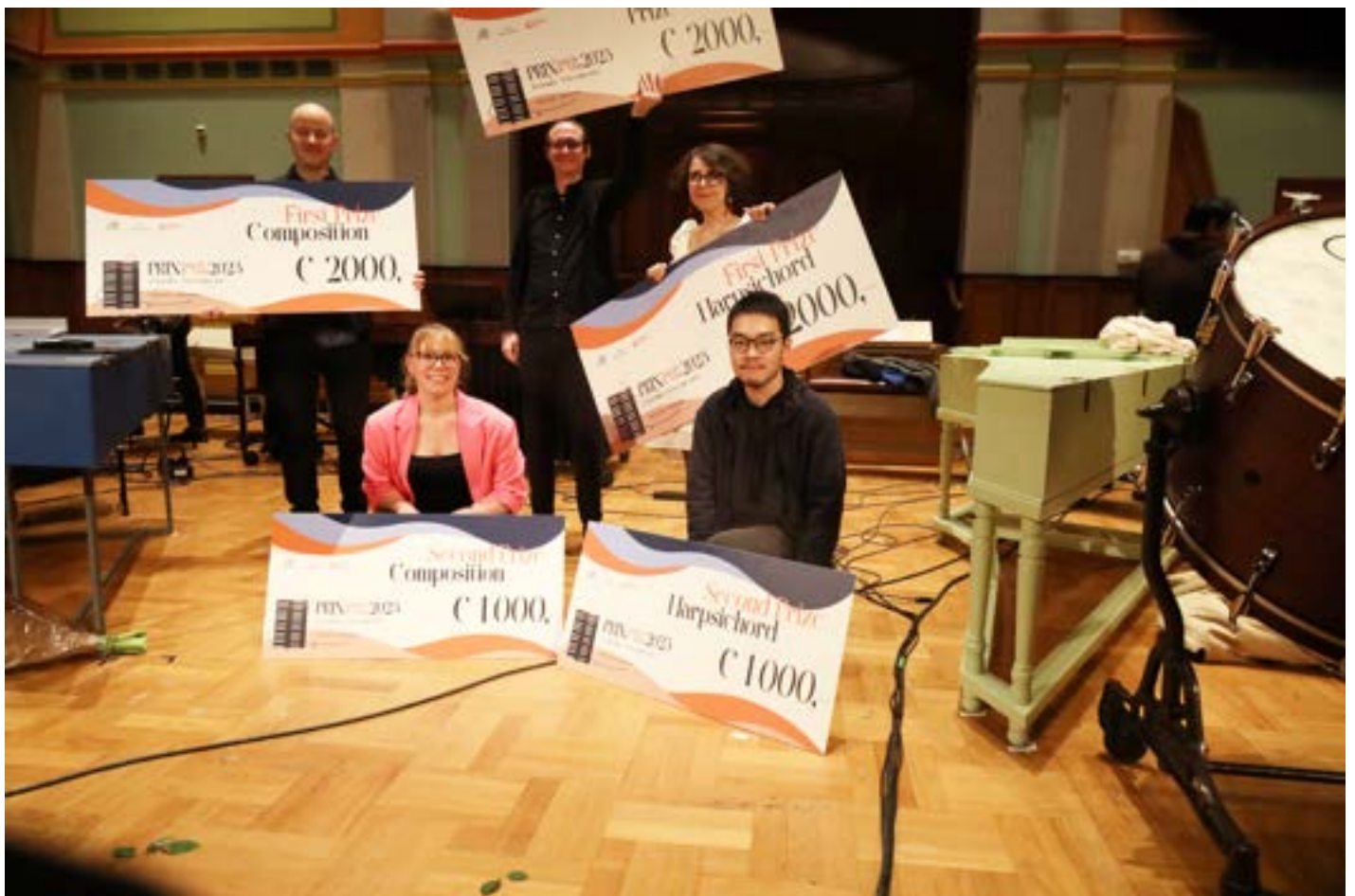
Prijswinnaars van de Prix 2023 concoursen